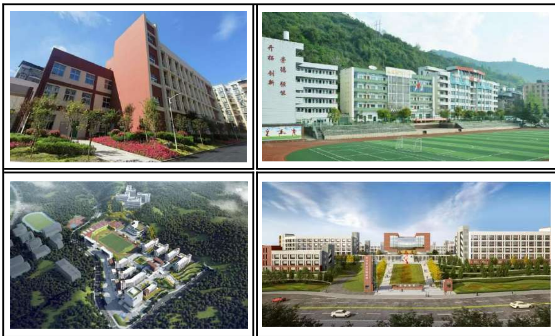
图 0-1 达州市职业高级中学