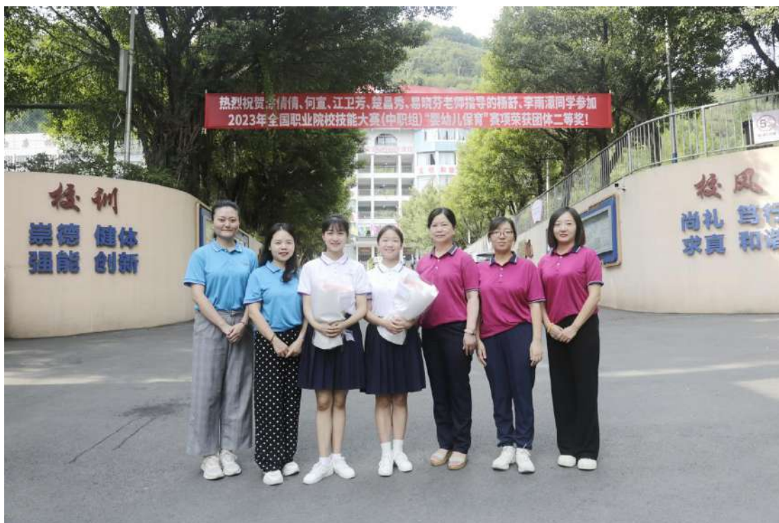
图 1-4 幼儿保育专业学生获国赛二等奖