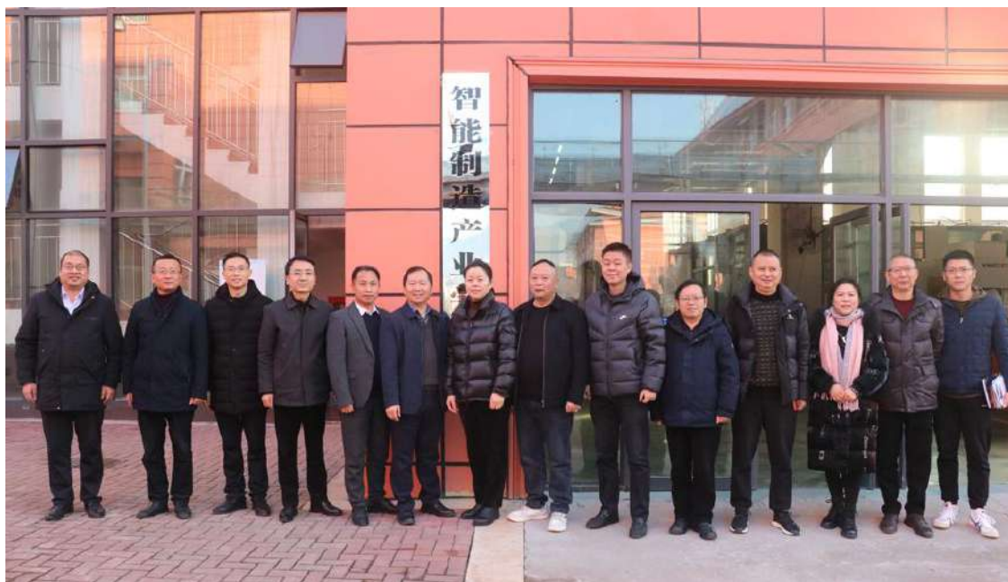
图 5-1 共建共享“智能制造产业学院”签约挂牌仪式

为进一步加强校企合作，深化产教融合，助力达州经济社会高质量发展及现代职业教育建设，达州技师学院、达州市职业高级中学、工匠智能装备科技（广东）有限公司共建共享“智能制造产业学院”。三方共同梳理和优化现有相关专业，打造智能制造专业群，以新修订职业教育法等相关法律、政策为指导围绕“服务装备领域+创新教学方法+坚持产教融合+搭建校企合作+优化管理模式”等五大内容进行建设和运营，在3-5年内打造区域顶尖、国内一流的集“产、教、学、研、创、转”于一体的高质量产业学院，为达州职业教育服务地方经济做出示范引领。