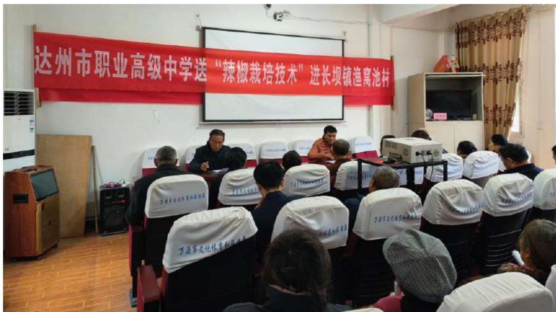
图 2-1 学校开展送技下乡、服务群众活动

学校积极发挥职业教育学校服务地方经济功能，面向社会开展技能技术、智慧助老、农业栽培、企业员工能力提升、普通话及礼仪培训等共计 8073 人次，优化方案、精选师资，采用理论授课、现场示范、指导、答疑解惑等多种培训方式相结合，保障培训效果和质量。