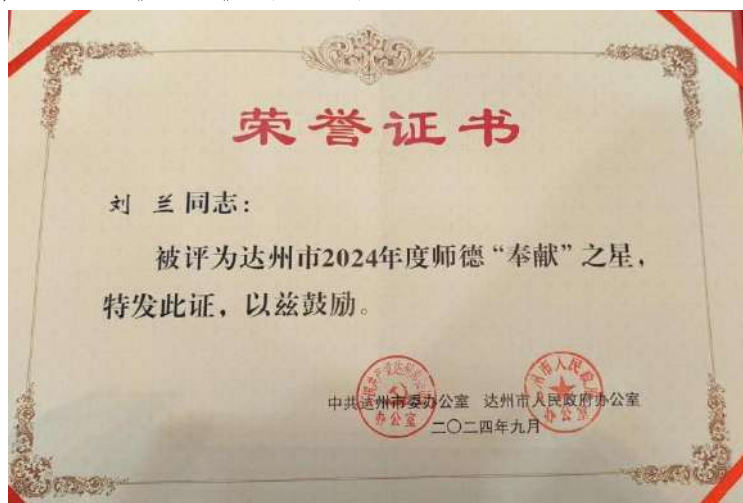
图 1-1 刘兰老师荣获达州市 2024 年度“奉献”之星

对内炼师德，对外促交流。学校进一步加强师德师风建设，通过开展师德师风专题培训、典型案例学习、年度考核与日常考核相结合等方式，强化师德师风教育，评选校级“三德之星”20人，其中1人被评选为市级“三德之星”。开展教师交流与合作，与四川财经职院、川南幼儿师范专科学校、达州职业技术学院等省内多所知名学校建立合作关系，拓宽教师视野，提升教育教学水平。