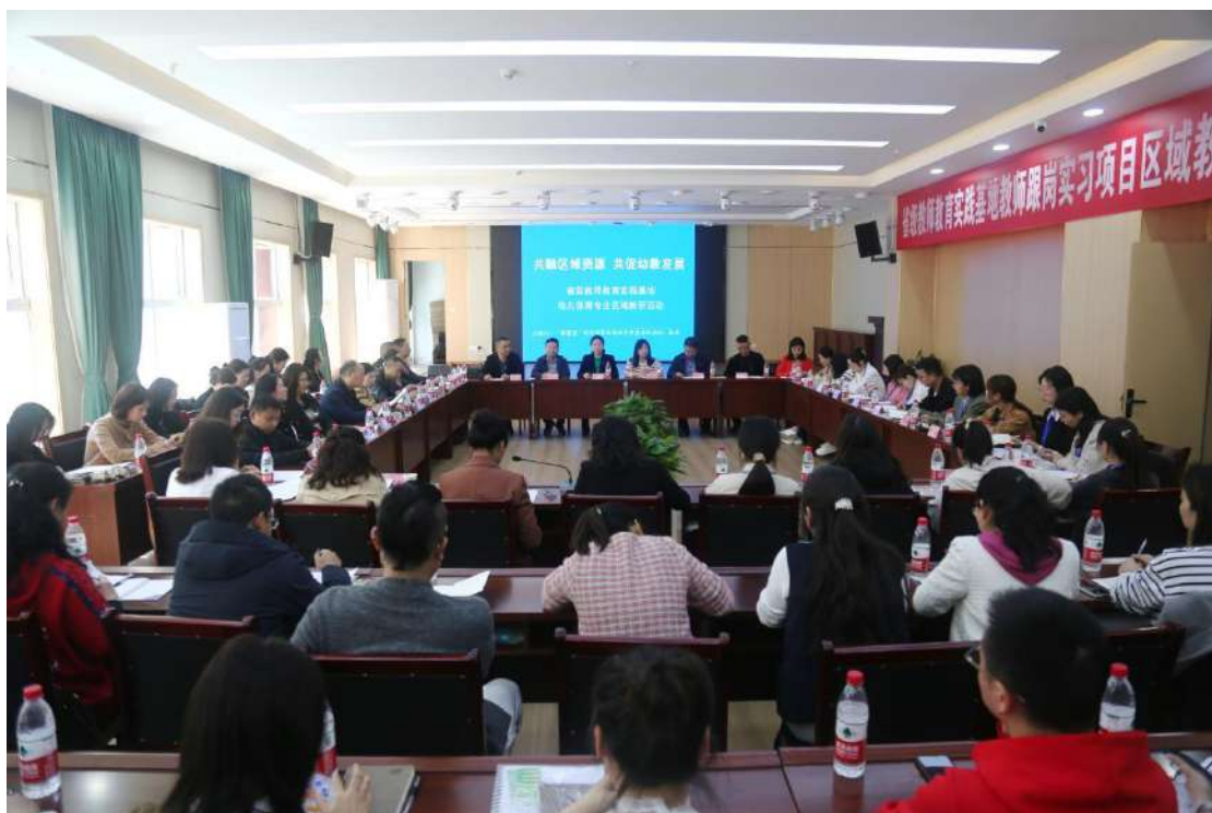
图 5-4 幼儿保育专业区域教研活动在我校附属幼儿园召开

倡议，希望能够加强区域之间幼儿教育的合作与交流，携手建立“区域幼儿教育联盟”，共融区域资源，共促幼教发展，不断提升学前教育、幼儿保育师资专业素养，共同推动区域幼儿教育高质量发展，区域幼儿教育联盟从而诞生。近一年以来，学校先后组织达州市政府机关幼儿园，通川区、达川区、达州高新区、达州东部经开区学前教育机构、万源市职业高级中学、四川省达县职业高级中学等职业中学开展多次教研活动。