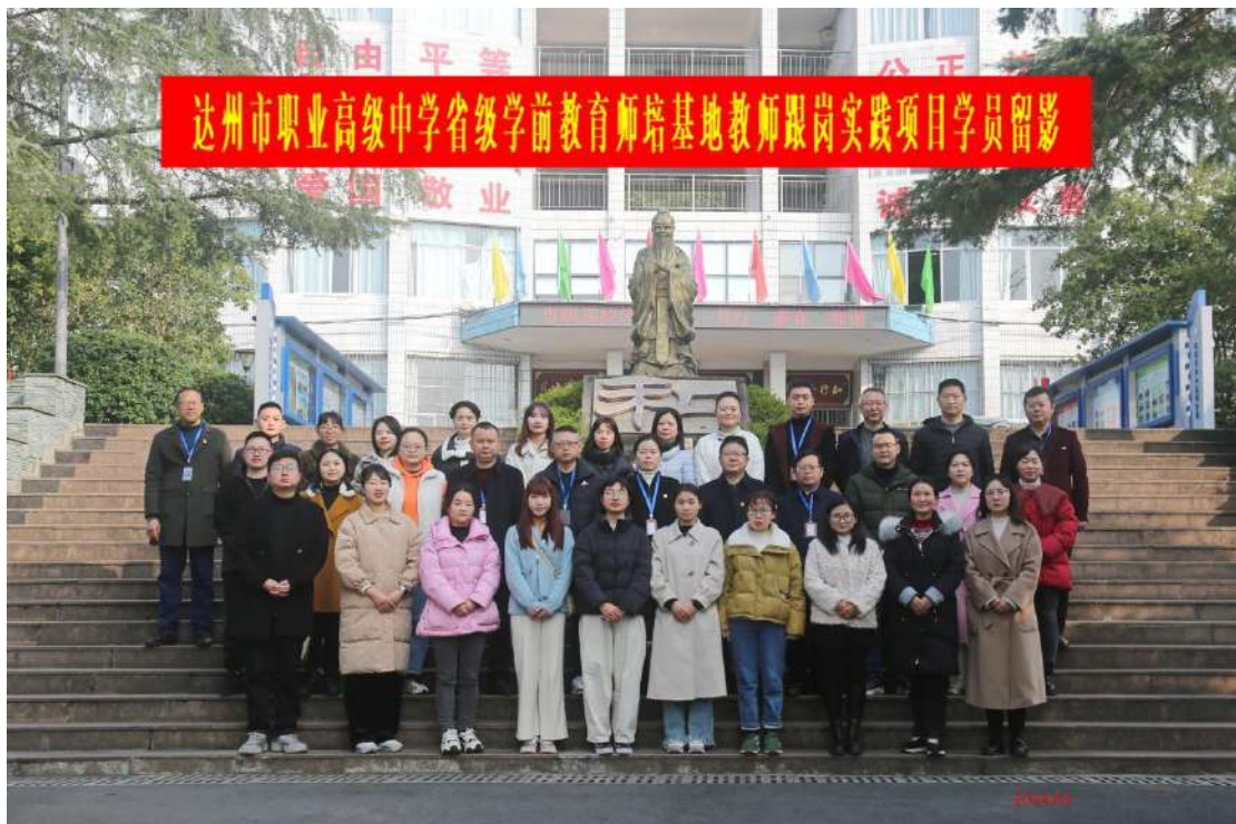
图 2-2 2023 年省级师培基教师跟岗访学实践项目圆满完成