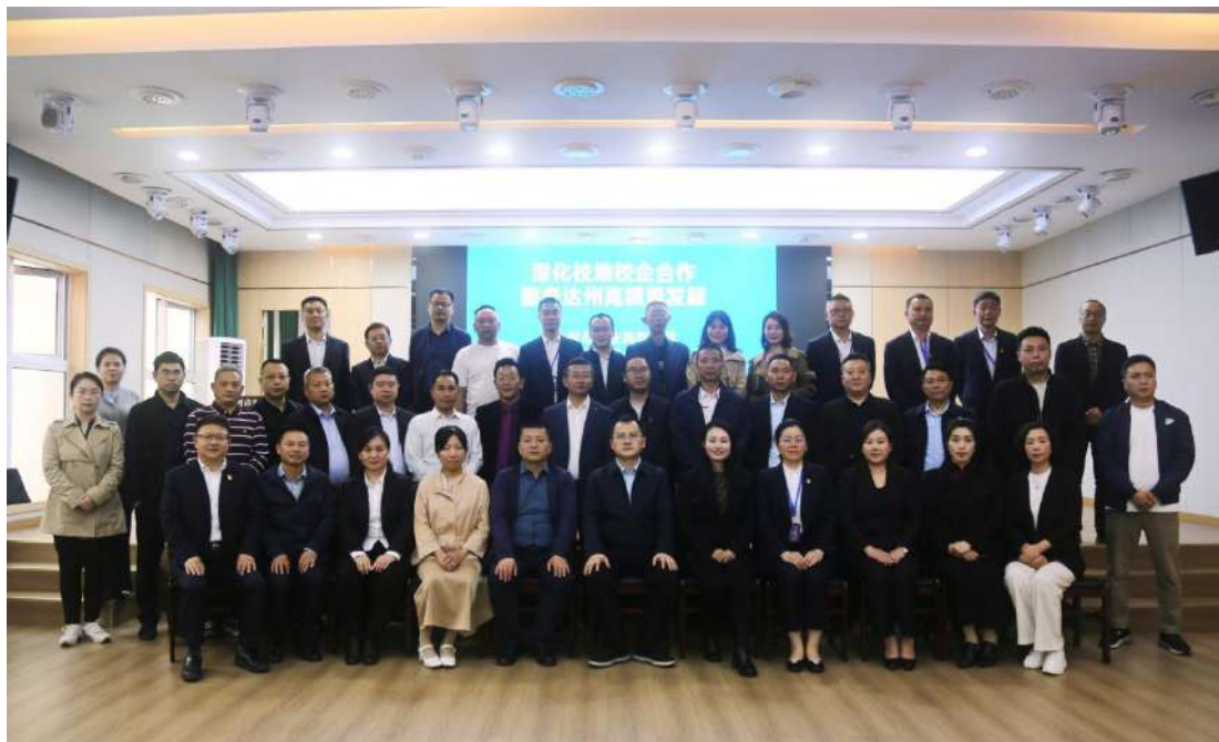
图 2-3 区域幼儿教育联盟组织召开专业建设委员会大会