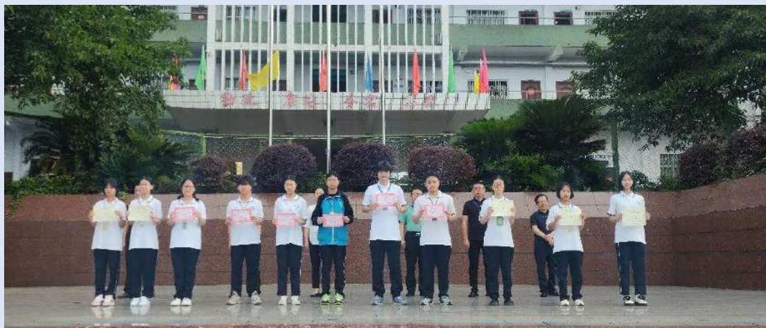
师生技能比赛涉及幼儿保育专业、工艺美术专业、运动训练专业、会计事务

新时代呼唤工匠精神，新发展需要高技能人才。为深入贯彻习近平总书记关于职业教育的重要指示，大力弘扬劳动光荣、技能宝贵、创造伟大的时代风尚，进一步营造全社会关心职业教育的良好氛围，达州市职高 2024 年职教活动周于 6 月 5 日-6 月 13 日隆重举行。本次职教活动周包括师生技能比赛、“我的技能青春/我的职业职教人生”征文活动、“我的职教故事”微电影作品征集活动等内容。“我的技能青春/我的职业职教人生”征文活动和“我的职教故事”微电影作品征集活动中，共收到来自各专业部 50 余份作品，评选出一等奖 5 个，二等奖 10 个、三等奖 16 个。