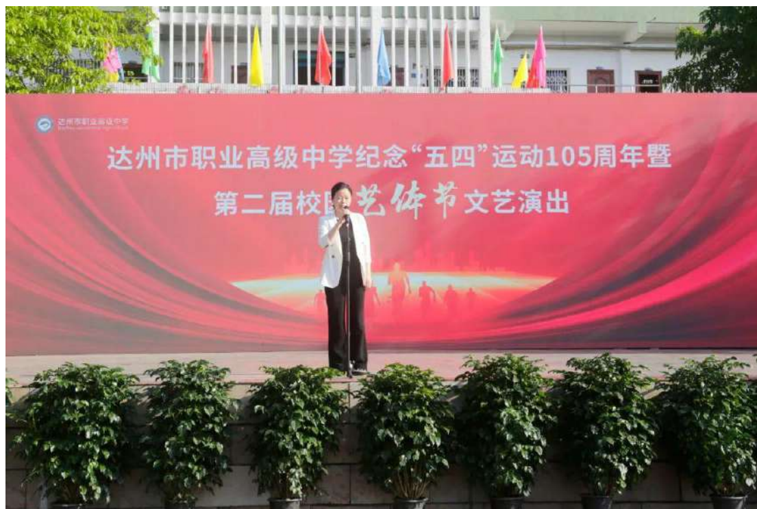
图 2-5 学校举行纪念“五四”运动 105 周年活动