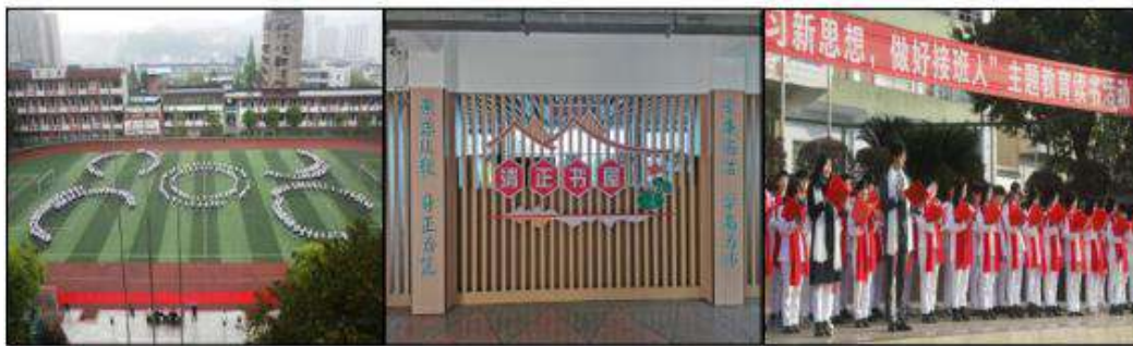
聚焦校园文化建设，着力打造三个校园：“书香校园”、“奔跑校园”、“清朗校园”

聚焦思想政治引领，着力实施三大行动。建立党组织领导的校长负责制“1+N”机制，实施“班子强基”行动。以“四心”“三德”主题教育，实施“教师铸魂”行动。开展“让校园更美好”“扣好人生第一粒扣子”等主题活动，实施“学生立德”行动。聚焦协同育人合力，着力构建三种体系。坚持以内涵建设为引领，发挥思政课程与课程思政协同育人作用，着力构建“学校+企业”“专业+产业”“岗位+课堂”育人体系。聚焦校园文化建设，着力打造三个校园。着力打造厚重、高雅、品味的“书香校园”；健康、奋进、活力的“奔跑校园”；清静、清新、清廉的“清朗校园”。聚焦立德树人任务，着力培养三有学生。