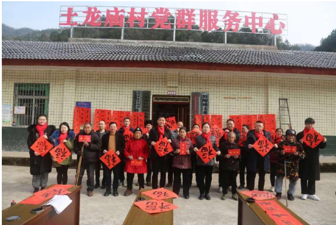
图 2-4 万源市竹峪镇土龙庙村开展党建结对慰问活动

的参与意识。学校组织农业技术人员到万源市竹峪镇土龙庙村、长坝镇渔窝池村开展托底性帮扶，消费农产品 2 万元，慰问困难群众 10 人、慰问金 3000 元，开展香菇、辣椒等农作物种植技术讲座 2 次，捐赠资金 15000 元。