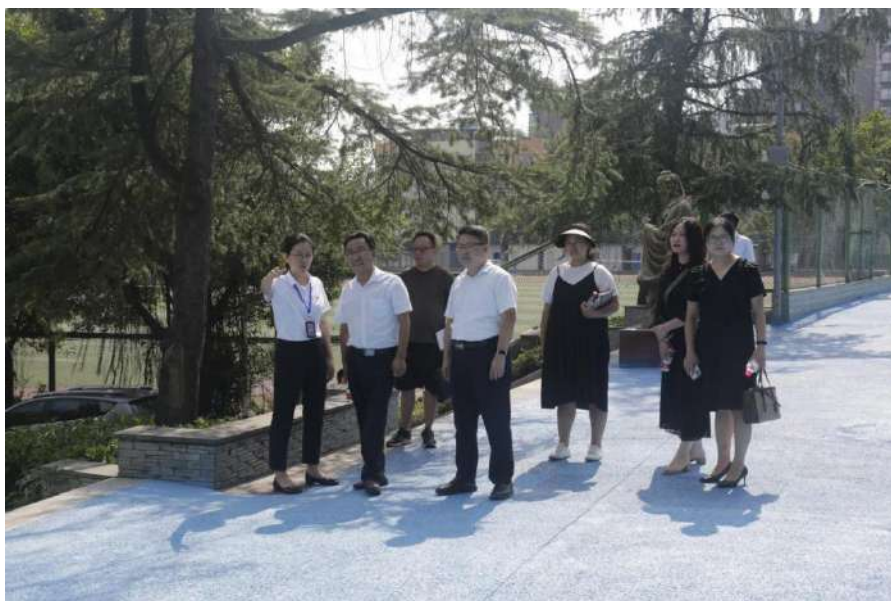
图 5-3 阿坝中等职业技术学校来校调研、交流

程改革、专业建设、技能培养等核心领域展开了深入探讨和实践交流。同时，学校还组织教师团队前往兄弟学校学习先进的教学理念和管理经验，并邀请多所学校专家来校指导，共同推动职业教育创新发展。这些交流活动不仅提升了学校的教育教学水平，也为职业教育的资源共享与合作发展搭建了桥梁。