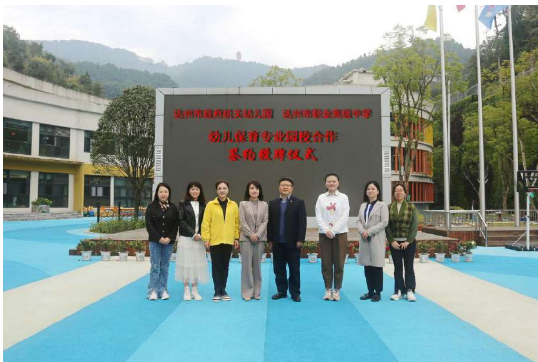
图 5-5 学校与达州市政府机关幼儿园合作签约授牌仪式

余所园所开展紧密的园校合作关系，包括识岗实习活动、幼儿园课程设置专题研讨会、中职幼儿保育专业课程设置研讨会等活动。达川区南坝幼儿园、达州市政府机关幼儿园等园校合作幼儿园，接连发来用人感谢信，对参加我校就业的学生给予了充分的肯定，表示我校学生在实习及就业等阶段，表现良好，在园期间多次多人荣获竞赛一等奖、优秀教师、优秀干部储备人才等荣誉。