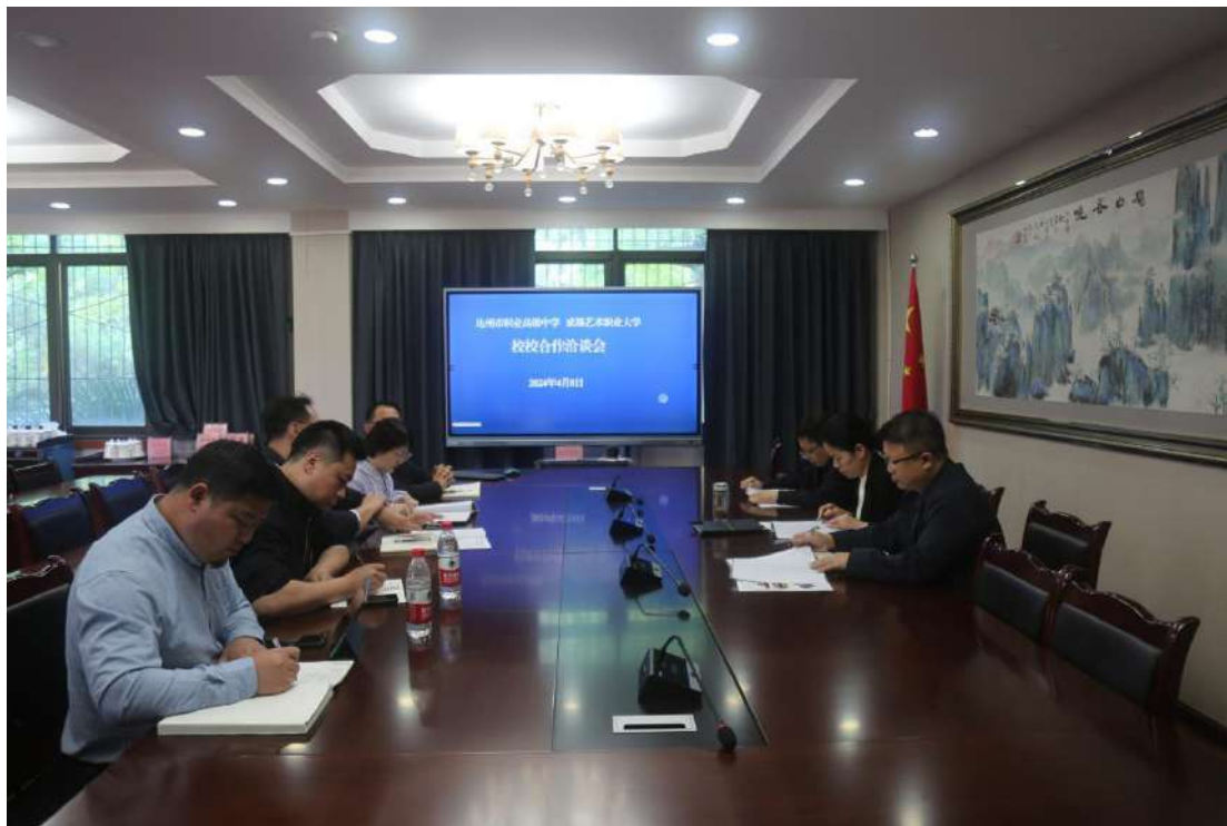
图 5-2 成都艺术职业大学来校开展合作洽谈

政府第四届教学成果奖三等奖。川南幼儿师专等中高职贯通培养合作高校连续几年对我校生源给予了良好反馈，曾多次发来喜报及感谢信。反馈指出我校“3+2”学生在高职阶段，继续参加高职类学生技能大赛，先后荣获 2023 年四川省职业院校技能大赛高职组婴幼儿照护赛项一等奖、2024 年世界职业院校技能大赛高职组婴幼儿照护赛项银奖；11 名 2023 届“3+2”学生在高职阶段通过专升本进入到本科院校，在高职院校期间 2024 年度 11 人升入本科院校。